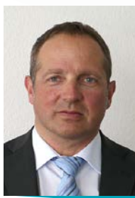
Jean-Pascal Lüthi, Vice-direttore e capo della Divisione Formazione professionale di base e maturità, Segreteria di Stato per la formazione, la ricerca e l'innovazione