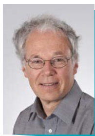
Ludwig Gärtner, Direttore supplente e capo dell'Ambito Famiglia, generazioni e società, Ufficio federale delle assicurazioni sociali