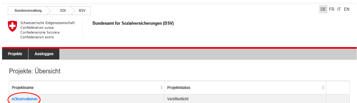
Abbildung 2: Einstiegsseite Portal

Hinweis für Observationsspezialistinnen und -spezialisten, die bei einer Sozialversicherung arbeiten und bereits als User für die Erfassung der Observations-Statistik im System erfasst sind: Mit der gleichen E-Mail-Adresse ist es nicht möglich, sich gleichzeitig für die Observationsbewilligung zu registrieren. Das Gleiche gilt umgekehrt: Observationsspezialistinnen und -spezialisten, die bereits als Gesuchsstellende registriert sind, können sich mit der gleichen E-Mail-Adresse nicht als Statistik-Userin bzw. -user registrieren. Nach dem Login kommen Sie auf die Übersichtsseite. Um mit der Erfassung Ihrer Daten zu beginnen, klicken Sie auf eObservationen (im Bild blau, unter der Rubrik Projektname).